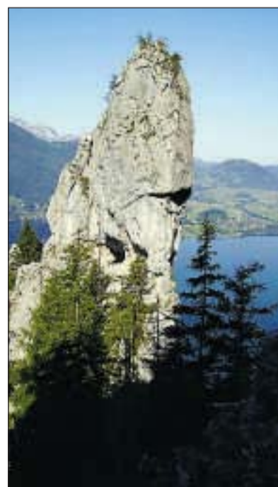
Liegt am Weg: der Sulzkogel (gary)

Für all jene, die sich dem Bergmarathon stellen, werden die OÖN die Freitag-Auflage ihres Salzkammergut-Lokalteils (mit spezieller Bergmarathon-Reportage) erhöhen und im Zelt zur freien Entnahme auflegen. (gs)